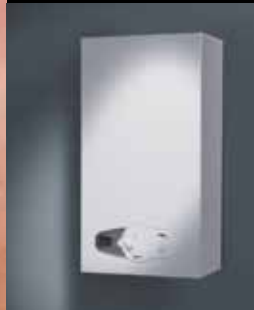
Badgeiser met AquaStart

Nergens vindt u zo veel keus in geisers als bij Nefit. Wilt u ruimte besparen? Nefit heeft de meest compacte badgeisers die er op de markt zijn. Extra veel energie besparen? Kies voor geisers met een ontsteking op duurzame waterkracht! Bij elke wens en elke situatie past een Nefit Spaargeiser. Uw Nefit-dealer adviseert u graag.