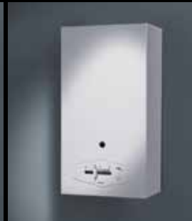
Badgeiser met Denkvlam